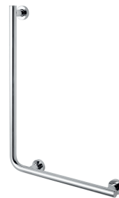
26.042R-SP stal polerowana