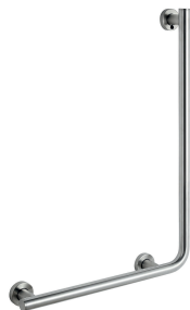
kod: 26.042L-SB stal szczotkowana