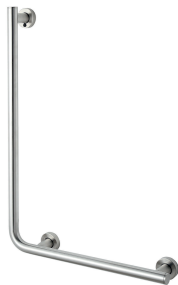
26.042R-SB stal szczotkowana